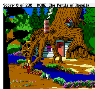
King's Quest 4, versione Atari ST

Tra le altre novità è il primo gioco di questa serie che include un reale orologio interno per gestire il passaggio dalla notte al giorno dato che alcuni enigmi si possono risolvere solo di notte.