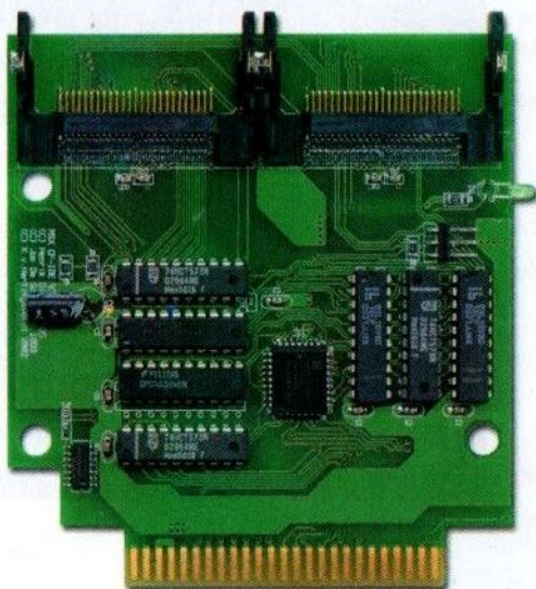
Compact Flash ATA-IDE

Prijzen: Add-on kaart voor ATA-IDE interface € 28,50 Compact Flash ATA-IDE € 63,55