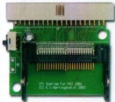
Add-on kaart voor Sunrise ATA-IDE interface

Add-on kaart voor de Sunrise ATA-IDE interface Losse Compact Flash ATA-IDE