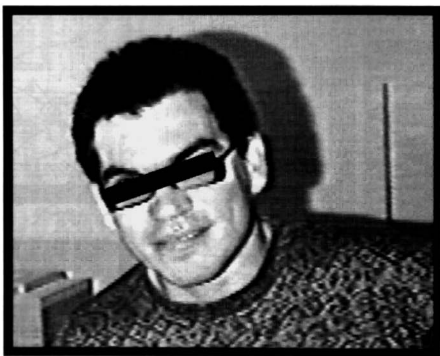
O alucinado detonou tudo o que viu pela frente