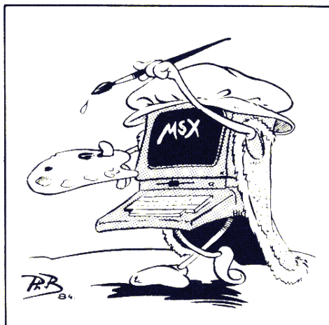
Dessinateur Programme pour MSX Auteur Jacques Boisgontier Copyright LIST et l'auteur

Pour obtenir une figure discontinue, presser sur V. Si l'on veut dessiner un cercle : on désigne son centre (une pression sur V) et l'un des points de