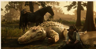
Jacaré lendário

Aqui, no entanto, além dos animais comuns, que fornecem alimentos e recursos básicos para criação de armadilhas e roupas mais simples, também existem 16 animais lendários .