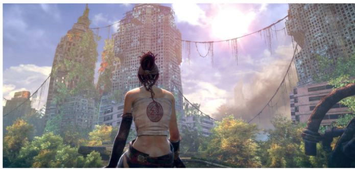
À esquerda, Monkey contempla a paisagem. Abaixo, Trip e sua mini-gun.

Sabe a comparação que fiz no lá no início do texto? Então, jogue sem a pretensão de esperar algo melhor. Depois disso, venha rir comigo quando terminar.