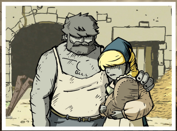
Um jogo com muito, mas muito "that feeling, bro"