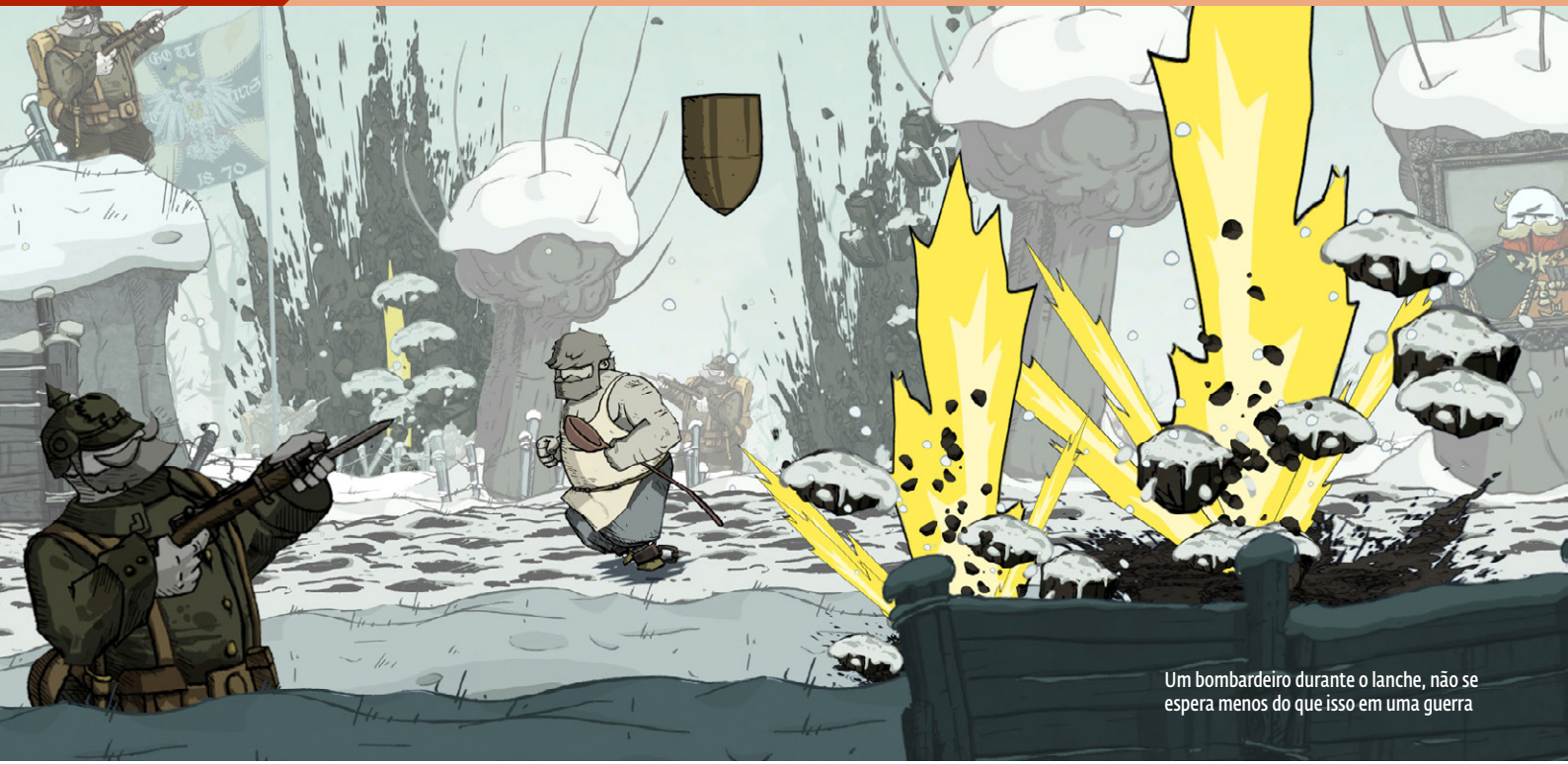
Um bombardeiro durante o lanche, não se espera menos do que isso em uma guerra

E xistem pontos positivos e negativos para qualquer forma de desenvolvimento. Quando se trata de Triple As, os blockbusters que todos jogam e falam, os desenvolvedores têm maior recursos à disposição, mas por ter muita gente envolvida no projeto, alguns acabam ficando