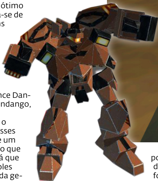
Vista seu robô e lock and load!

E quando digo "além", quero dizer uma história coesa, com surpresas e escolhas que mudam o rumo da fase oferecendo até novos mapas, um final satisfatório e, sempre que