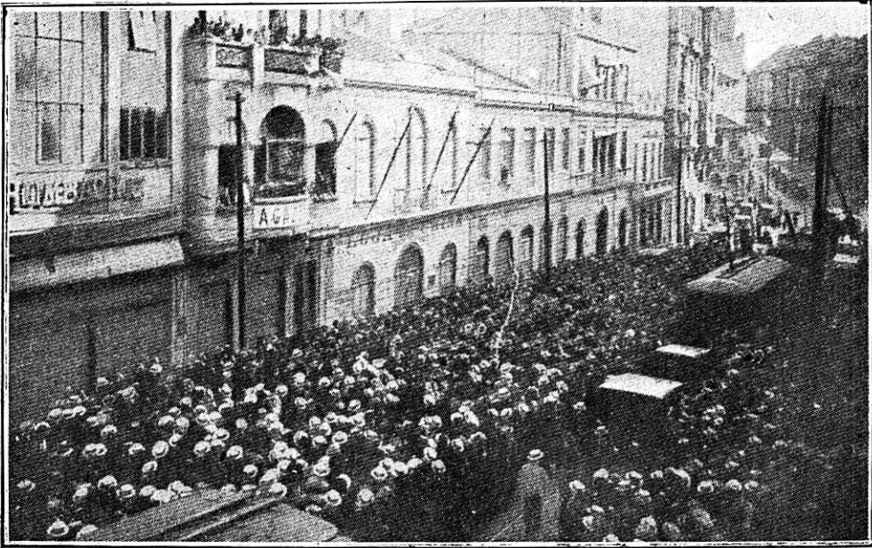
Muchedumbre frente a la redacción de un periódico extranjero enterándose de las últimas noticias de un campeonato de foot-ball

Americano de Ingenieros electricistas. Secciones de tal Congreso se encontraban en San Francisco, Chicago, Filadelfia, Atlanta, Boston y New York. Diversos discursos fueron escuchados al mismo tiempo por todos los miembros de la Asamblea, utilizando líneas y montajes de una de las grandes Compañías americanas. El total