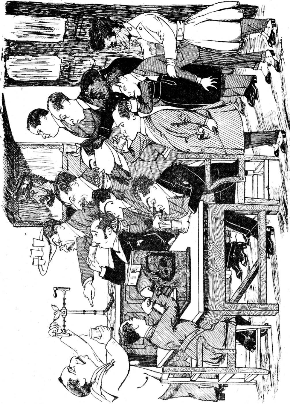
La cantina de la Central de Telégrafos de Madrid a la hora del desayuno con los concurrentes más asiduos