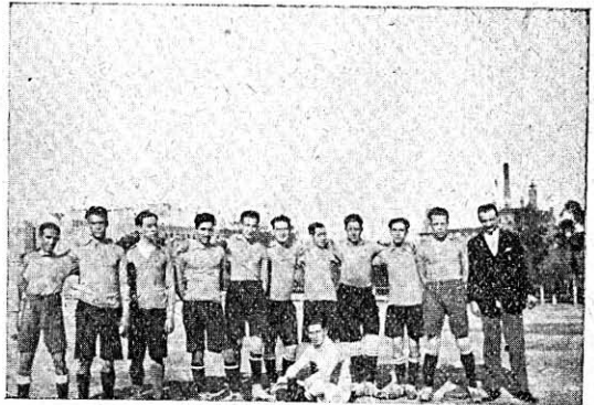
Grupo de telegrafistas de la Central que forman el aguerrido equipo futbolista, después de haber jugado un partido.

Se ha fundado en Madrid una agrupación de telegrafistas que lleva por título Sociedad