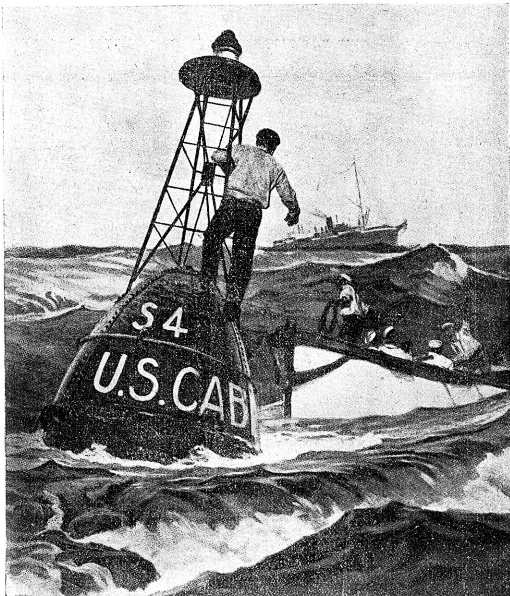
Una de las operaciones más difíciles en el tendido de cables submarinos es la colocación de las boyas que indican los lugares en que aquéllos se hallan. En el grabado se ve, a lo lejos, el buque cablero, y, en primer término, los expertos marineros en una de las más expuestas tareas.