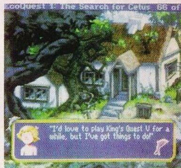
A aventura "Eco Quest"

Seguindo a criatura deparamos com uns destroços de uma nave.