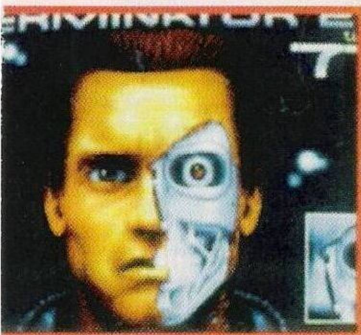
"Terminator 2" no Spectrum

duzirá à assembleia. O senador congratula-nos pelo feito e entregamos a sua máscara. Atrás do golfinho vamos parar ao cenário dos três olhos, repetimos a cena do tridente (pressionar os três olhos simultaneamente com o auxílio do tridente), só que desta vez o efeito é diferente.