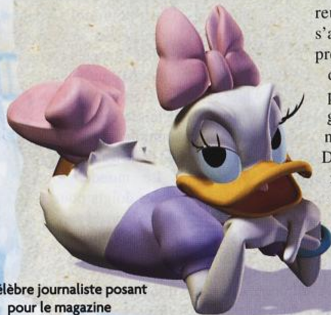
La célèbre journaliste posant pour le magazine "Les Célébrités"

réussi à pénétrer dans le temple secret de Merlock, le redoutable magicien. Et hier, en matinée, des millions de téléspectateurs ont regardé son reportage en direct sur les ondes de la chaîne locale. Malheureusement, au moment où Daisy s'apprêtait à nous montrer pour la première fois le terrible Merlock dans son temple, le destin a frappé : Merlock l'a surprise. L'image s'est alors brouillée et personne ne sait ce qu'il est advenu de Daisy. La population est consternée. Nous espérons avoir plus de détails bientôt.