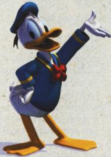
Donald Duck posant pour le magazine "Nos Vedettes".

Le Journal de Donaldville – Edition Spéciale