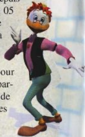
L'inventeur Géo Trouvetou dans "Le Dictionnaire des Grands Penseurs"

Grâce à une invention de M. Trouvetou, Donald pourra être téléporté à travers le monde, puis jusqu'au temple de Merlock pour sauver Daisy. Voici ce que Géo Trouvetou avait à nous dire : " Mon téléporteur sera capable d'envoyer Donald au temple de Merlock, sans problèmes. Mais d'abord, nous devons le rendre plus puissant. C'est pourquoi Donald parcourt le monde entier. Je ne peux vous en dire plus " Rappelons que Daisy est portée disparue depuis hier (voir notre article du 05 juin). Tout laisse croire qu'elle est maintenant la prisonnière de l'effroyable Merlock. Le monde entier croise les doigts pour que l'infatigable Donald parvienne à la sauver. Plus de détails dans nos prochaines éditions.