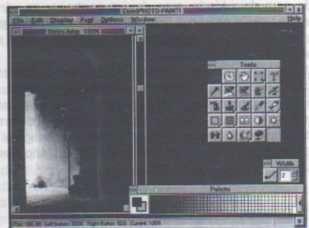
Figura 1-3. — A PhotoPaint da Corel, um pacote de edição de imagens incluída no CorelDraw! 3.0.

Podem mesmo gravar várias iterações da mesma imagem como efeito especial de sessão de diapositivos.