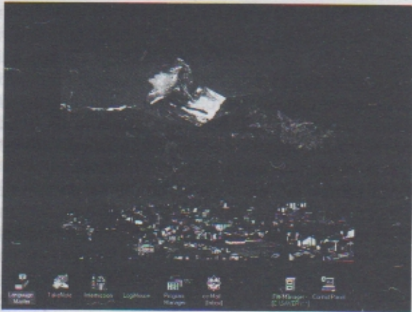
Figura 1-1. — Um ecrã de fundo personalizado do Windows da Microsoft, completado com um diapositivo de descanso digitalizado.

Se passarem por uma secretária de onde alguém saiu há 10 ou 15 minutos, é provável que vejam um screen saver ou imagem de fundo com o filho dessa pessoa, fotografias recentes das férias, uma cena de Star Trek , ou um desenho geométrico audacioso que atravessa o ecrã em vez de uma folha de cálculo ou de um ecrã em branco (os primeiros screen savers faziam exactamente isso: limpavam o ecrã). Esta nova forma de arte no escritório dá uma identidade pessoal ao minúsculo mundo rotineiro dos ambientes actuais dos escritórios — e fá-lo dinamicamente, diferentemente de uma foto emoldurada numa prateleira.