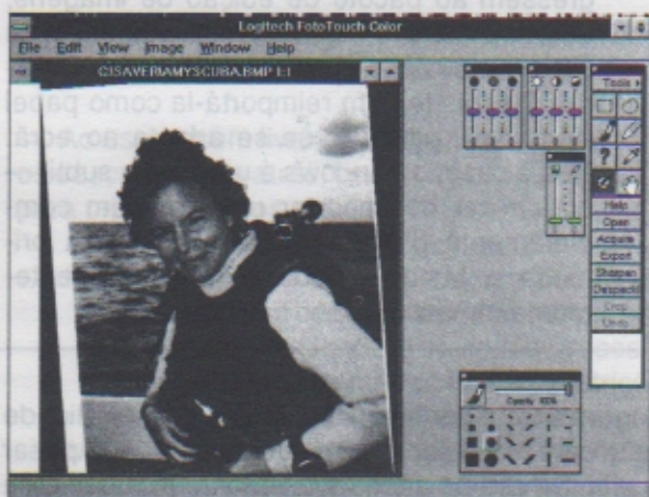
Figura 1-2. — Uma imagem revista pronta para ser manipulada e gravada para usar como ecrã de fundo no Windows.

A primeira questão a encarar é que tipos de imagens planeiam rever: texto (que um scanner revê como uma imagem) ou fotografias/desenhos. Depois, precisam de cor? Qual o nível de resolução de que precisam? Se estiverem a rever desenhos de linha e ocasionalmente fotografias para usar como ecrãs de fundo apenas num ecrã VGA ou para imprimir numa impressora laser, não precisam de um scanner de elevada qualidade. Se tiverem um super VGA e imprimirem uma circular da empresa, ou se quiserem as imagens com qualidade fotográfica apresentadas como ecrãs de fundo ou se quiserem usá-las para criar apresentações à base de diapositivos, precisam de uma coisa melhor.